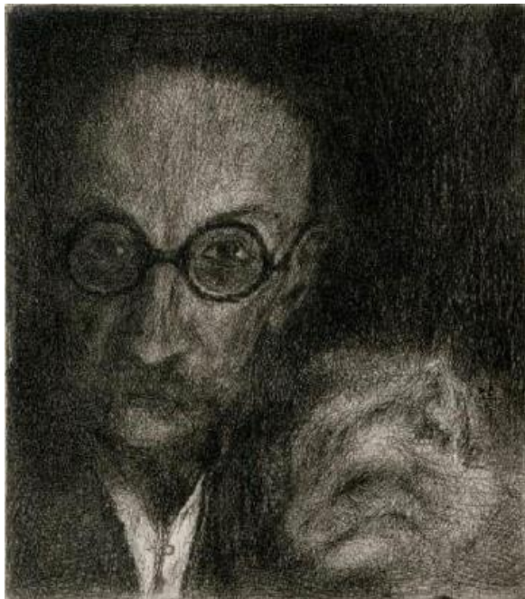
grafika – autoportrét s kočičkou

(31. května 1892, Petrkov – 28. září 1971, tamtéž)